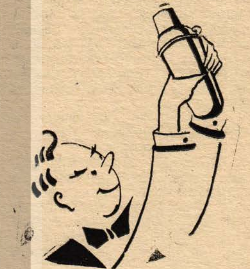
Tatlı Sert Kokteyli Cin veya Votka ile (isteğe göre birkaç damla limon suyu)