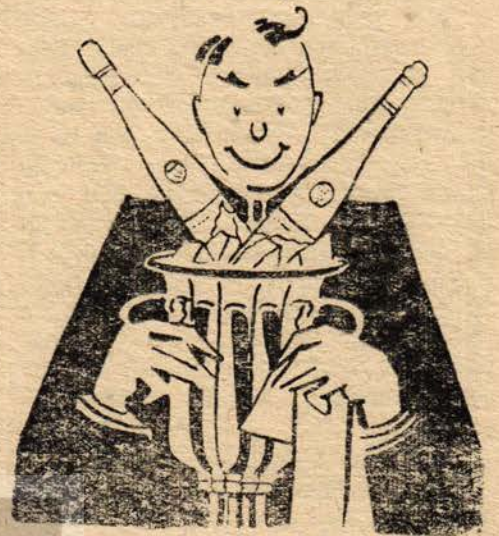
Buzla da içilen serinletici bir içkidir