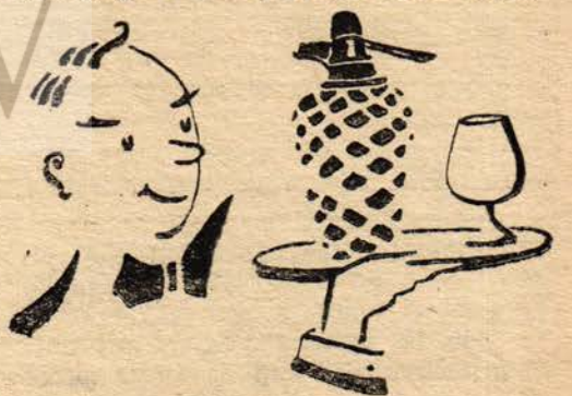
Soda ile KAVAKLİDERENİN Yeni Aperitif Şarapları Beyaz ve Kırmızı